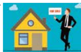
Illustration: Mohamed Hassan/ Pixabay

Immobilienprofis, die Ihnen das Leben leichter machen