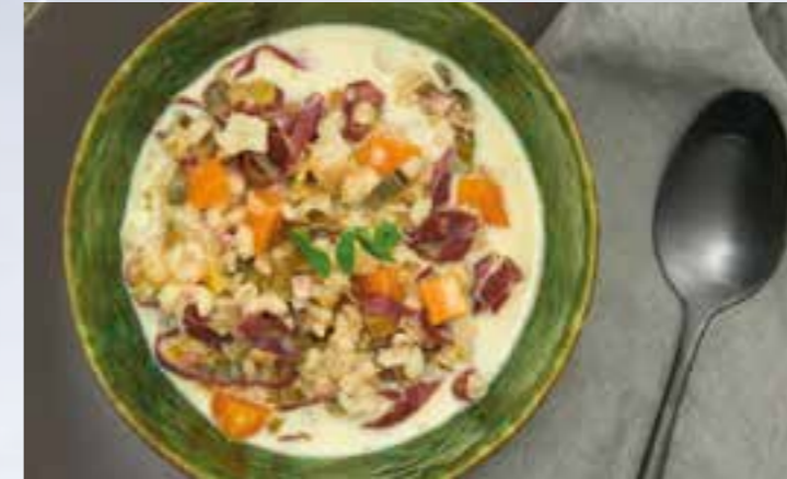
Die Bündner Gerstensuppe ist mit dem passenden Kochgeschirr schnell zubereitet.

Mit dem passenden Kochgeschirr ist die Lieblingssuppe schnell gezaubert. Ein Schnellkochdeckel reduziert die Kochzeit um bis zu 80 Prozent. Zwei Schnellkochprogramme sorgen dafür, dass alle Zutaten bei perfekter Temperatur schonend gegart werden. So bleiben Vitamine, Nähr- und Mi-