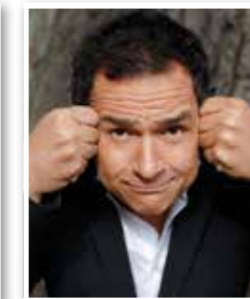
Bergkamen Seite 12 Kulturhighlights November

Impressum Ortszeit Kreis Unna Herausgeber und Verlag: FKW – Fachverlag für Kommunikation und Werbung GmbH Delecker Weg 33 59519 Möhnesee-Wippringsen Telefon: 02924/87 970-0 Telefax: 02924/87 970-29 E-Mail: info@fkwverlag.com