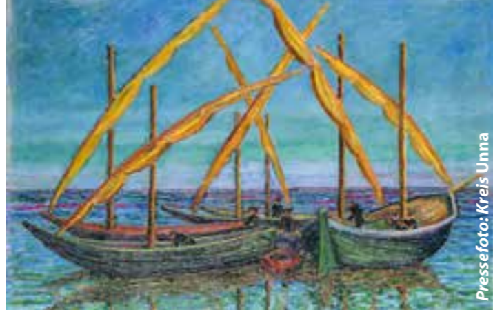
Boote im Meer, 1953, 60,5 x 73,0 cm, Öl auf Leinwand, Privatbesitz.

1937 wurden im Zuge der Aktion „Entartete Kunst“ einige seiner Werke aus dem Städtischen Kunst-