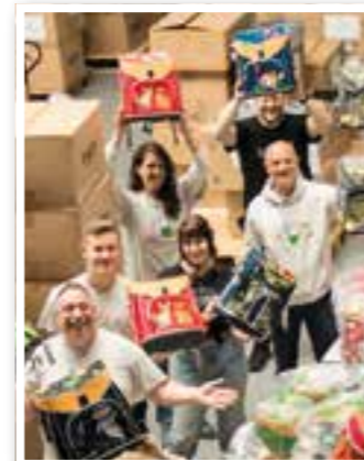
Story des Monats Seite 4 Stiftung Kinderglück