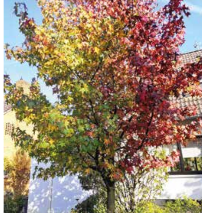
Der Amberbaum ( Liquidambar styraciflua )

Die Liste von Gehölzen mit intensiven Laubfarben ist umfangreicher, als man vielleicht meinen mag. Daher ist es ratsam, sich mit einer Landschaftsgärtnerin oder einem Landschaftsgärtner zusammenzutun. Die Profis kennen das Sortiment und beraten professionell, welcher Baum in seinem