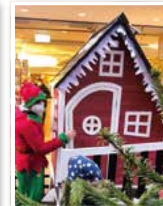
Kreis Unna Seite 8 Weihnachtsmärkte