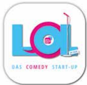
Logo: Stadt Bergkamen

„LOL – Das Comedy Start-up“ kommt jetzt auch nach Bergkamen! Werdet zur Comedy Spürnase und entdeckt bei der LOL-Show am Freitag, 25. November, um 20 Uhr im neuen Veranstaltungsraum des Stadtmuseums vielleicht schon die Stars von morgen!