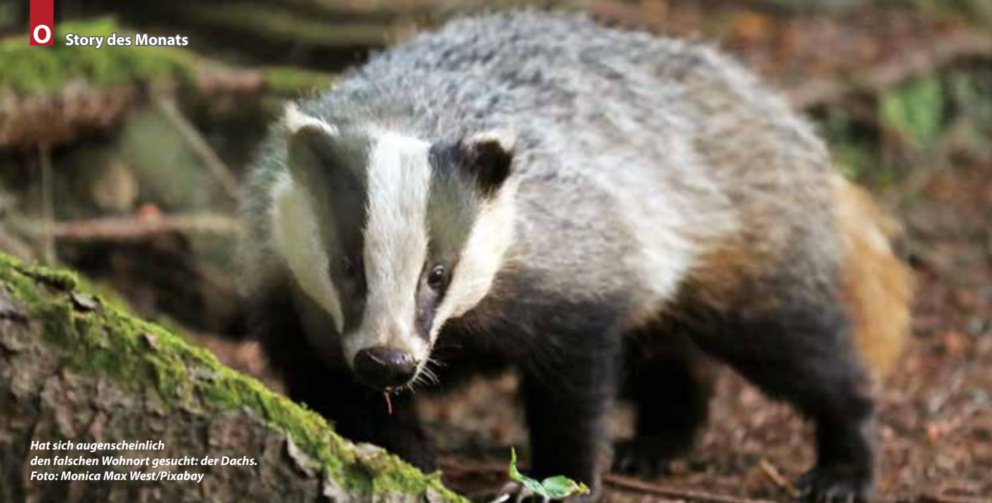
Hat sich augenscheinlich den falschen Wohnort gesucht: der Dachs.