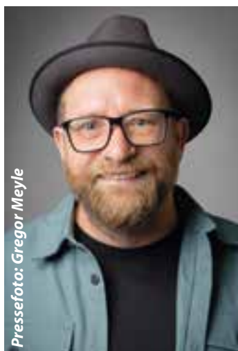
Pressefoto: Gregor Meyle