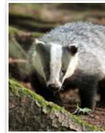
Story des Monats Seite 4 Dachsdesaster in Fröndenberg

Termine 27 Veranstaltungen in der Region