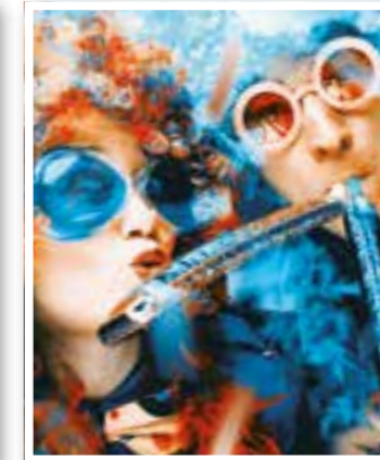
Unna Seite 6 Karneval im Kreis