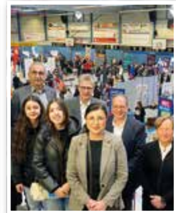
Bergkamen Seite 11 Ausbildungsmesse