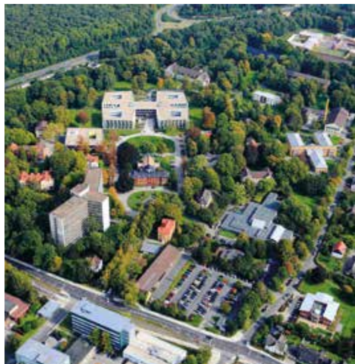
Die LWL-Klinik Dortmund von oben.

Wer seine Ausbildung abgeschlossen hat, hat in der Regel zwei große Wünsche, die nicht recht zusammenzupassen scheinen: „Erstmal Urlaub“ und die erste Festanstellung. Die LWL-Klinik Dortmund bietet Pflegekräften jetzt die ideale Kombination an.