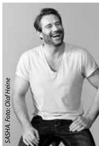
SASHA.

Kurz vor Weihnachten gab das Kulturzentrum Lindenbrauerei in Unna die Sommer-Highlights für das Jahr 2024 bekannt. Im August kommen Gregor Meyle und SASHA für je ein Konzert auf den Platz der Kulturen in Unna!