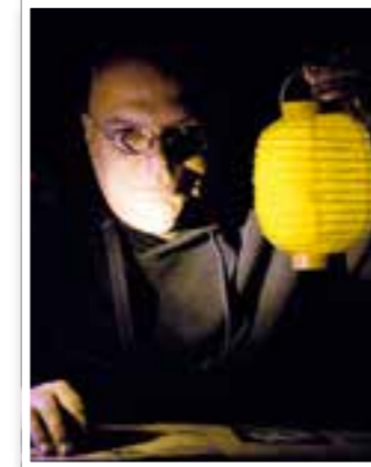
Story des Monats Seite 4 Autor Michael Wrobel