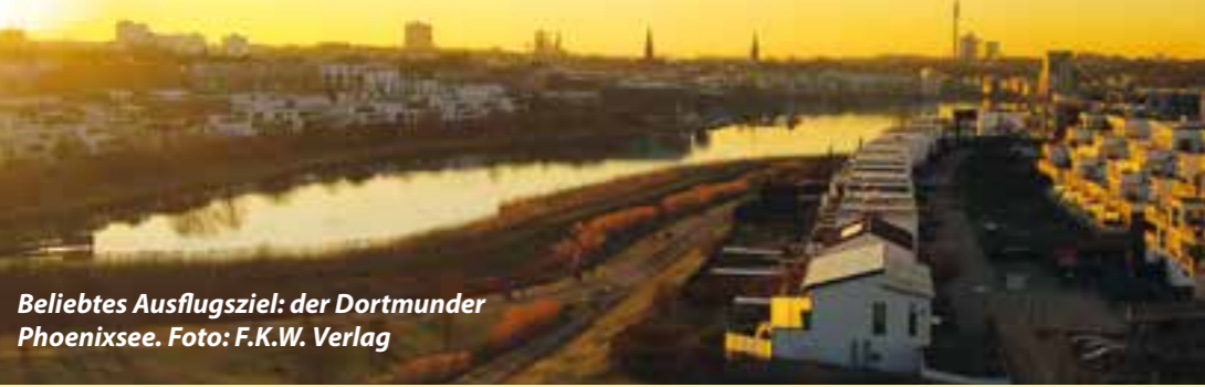
Beliebtes Ausflugsziel: der Dortmunder Phoenixsee.

Zu Ostern was mit der Familie unternehmen