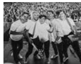
Max im Parkhaus.

Das Projekt „achtung! Lyrics“ lockt Singer-Song-Writer:innen nach Massen. Ihnen wird eine einzigartige Bühne geboten, um ihr künstlerisches Werk einer breiten Öffentlichkeit zu präsentieren.