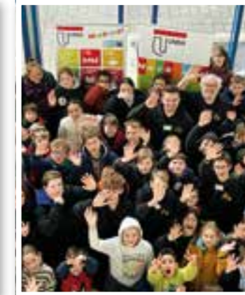
Unna Seite 7 Schulwettbewerb