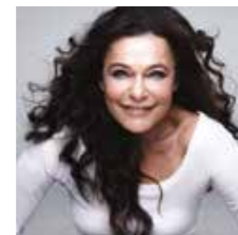
Julia Neigel.

drucksformen, die das Publikum begeistern und bewegen werden. Den Anfang macht am Sonntag, 3. März, um 15 Uhr Julia Neigel mit ihrem Auftritt bei Deifuchs Event Location. In der ersten Hälfte der Veranstaltung geht Julia Neigel auf ihre Songtexte ein. Das Publikum wird interaktiv in Gesprächsform eingebunden. Im zweiten Teil steht ein kleines aber feines akustisches Konzert im Mittelpunkt. Julias grandiose Stimme nur begleitet von einer akustischen Gitarre. Ob ihr Hit „Schatten an der Wand“ an diesem