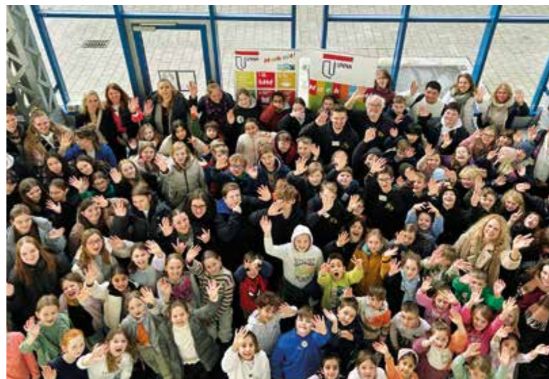
Schüler:innen von Grundschulen, weiterführenden Schulen und Berufskollegs aus Unna beteiligten sich am Wettbewerb „Fairbessere die Welt“.

Große Resonanz auf Schulwettbewerb „Fairbessere die Welt“