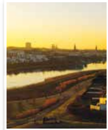
Ostern Seite 18 Ausflugstipps