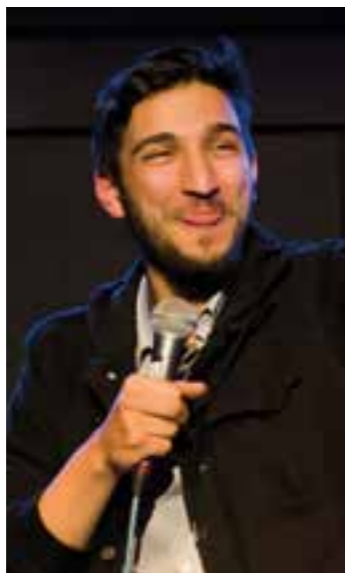
Newcomer Brahim.

Auch die erste Show des neuen Jahres im FZ Lünen Höhe hat es wieder in sich! Dafür sorgen drei höchst unterschiedliche Gäste aus Köln, Rheine und Münster, sowie Moderator Mario Siegesmund.